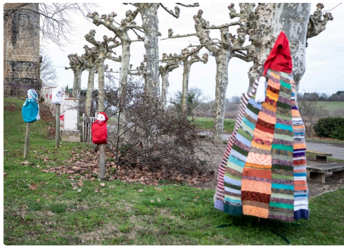
Mounaques devant l'église