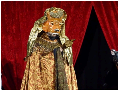
Les Fables de La Fontaine