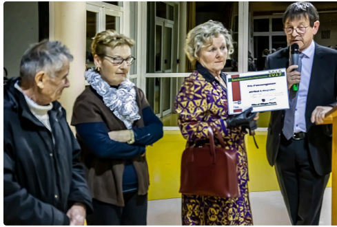
L'équipe de fleurissement reçoit un diplôme d'encouragement