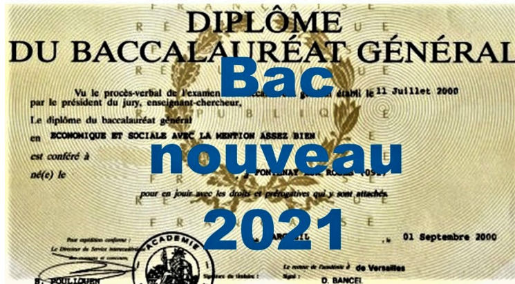
Le bac nouveau, c'est parti !

Première épreuve du nouveau bac 2021, première historique ! 1010 gersois sont concernés aujourd'hui.