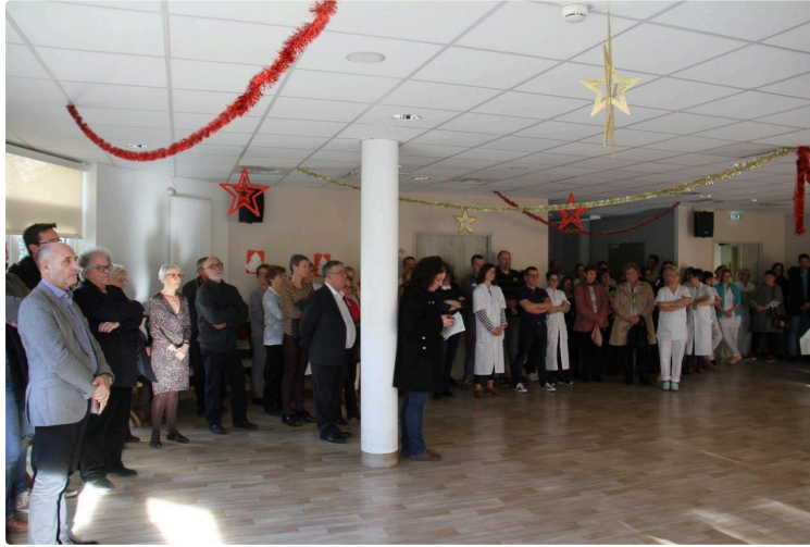
Un hôpital en bonne santé, à taille humaine, attractif et de qualité

2019, l'année de l'épilogue d'un trop long combat pour les services de santé de Condom avec la bonne nouvelle : l'autorisation par l'Agence régionale de santé (ARS), à compter du 1er septembre 2019, de réouverture de la Structure Mobile d'Urgence et de Réanimation (SMUR), 24 heures sur 24, sept jours sur sept, mais aussi le maintien des services d'urgences.