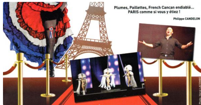
Un gala pour les chiens guides d'aveugles

Une action positive de plus pour le Lion's Club