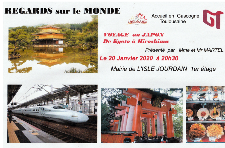
Un périple au Japon raconté par deux voyageurs lislois