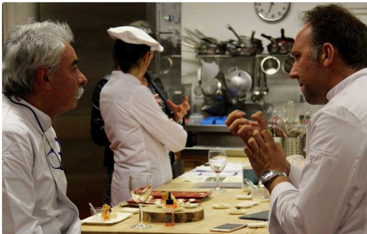
La restauration, un secteur qui recrute

De nombreux établissements sont en quête de personnel