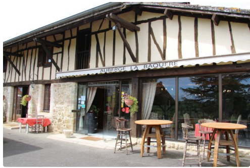
A Préron, l'Auberge La Baquère @Alain Martin