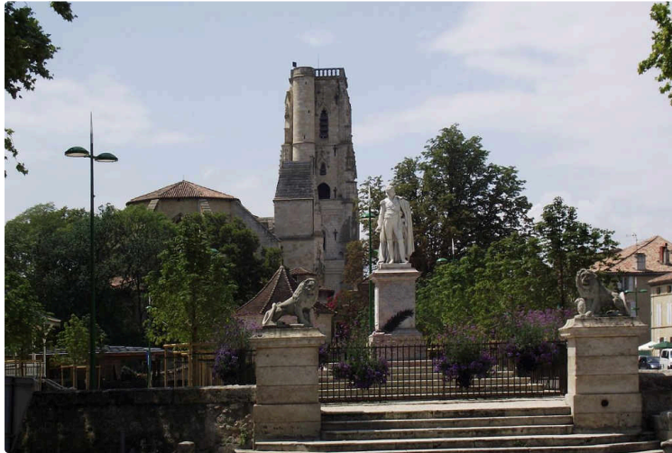
Itinéraires Artistiques du Pays Portes de Gascogne

La commune de Lectoure a lancé un appel à candidatures pour une œuvre originale Art & Environnement