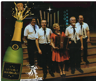
Un grand réveillon avec les Bals mirandais