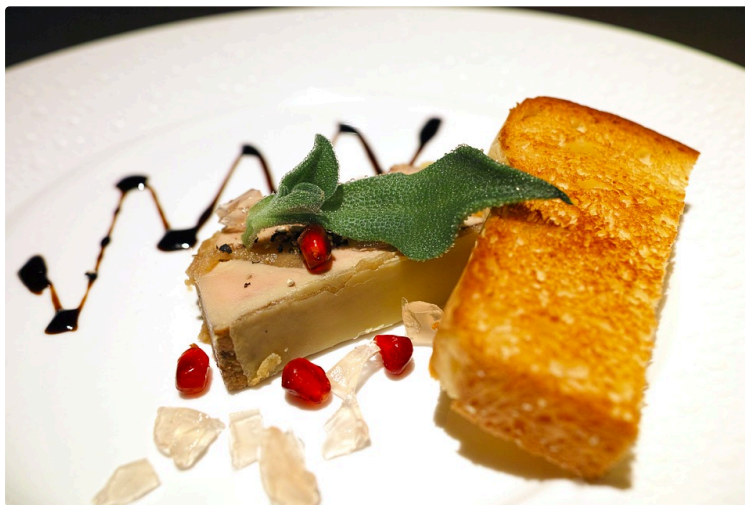
Le foie gras reste le N°1 des fêtes

Malgré les attaques dont il fait l'objet, 92 % des Français en consomment