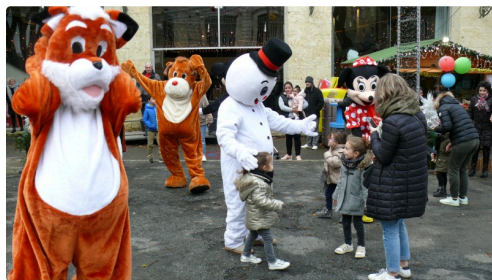
Les peluches géantes toujours aussi attractives avec les enfants.

Ce lundi 23 décembre, les enfants ont eu droit à un concert de Jamy & The Kids qui enthousiasma le jeune public et tout autant leurs parents, à la visite des rennes du Père Noël et des grandes peluches, alors que le petit train sillonnait la ville.