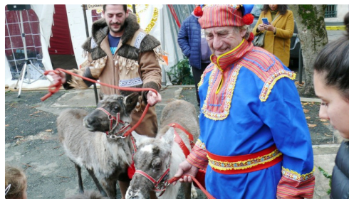
Les rennes du Père Noël.