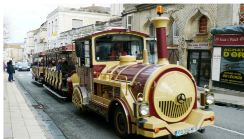
Le petit train remonte la rue Gambetta.