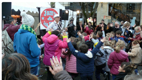
Un jeune public très enthousiaste pour le spectacle de Jamy & The Kids.