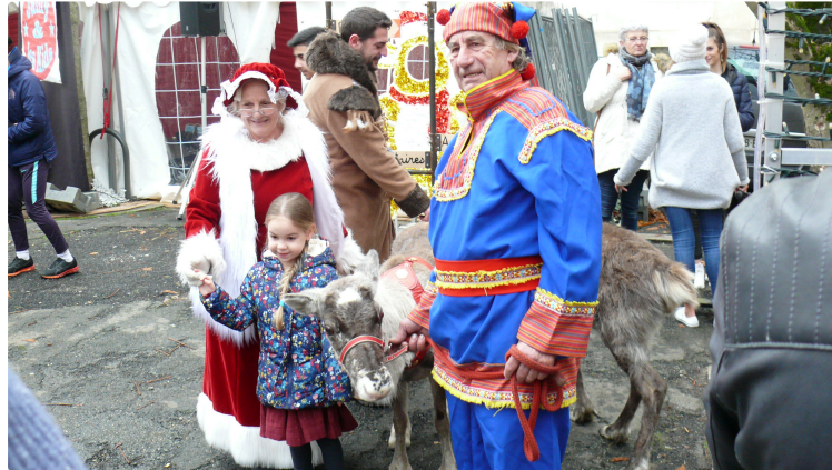
Les animations des fêtes de Noël connaissent un franc succès

Les animations pour les enfants se succèdent dans la ville pour ces fêtes de Noël, elles se concluront le mardi 23 décembre, sauf pour les manèges de la fête foraine au quai Lissagaray qui resteront jusqu'au 5 janvier, de 14 h à 21 heures.