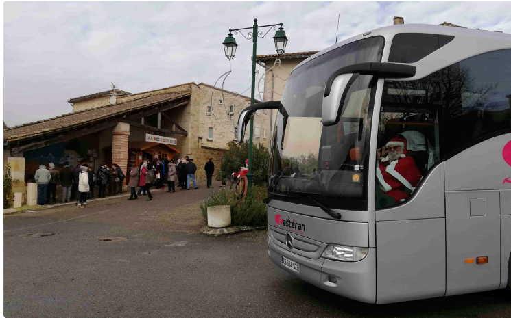
Dernière étape 2019 pour la Ronde des crèches autour de Miradoux