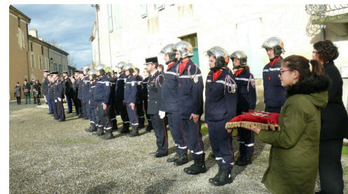
Une partie des pompiers qui assistaient à la cérémonie.