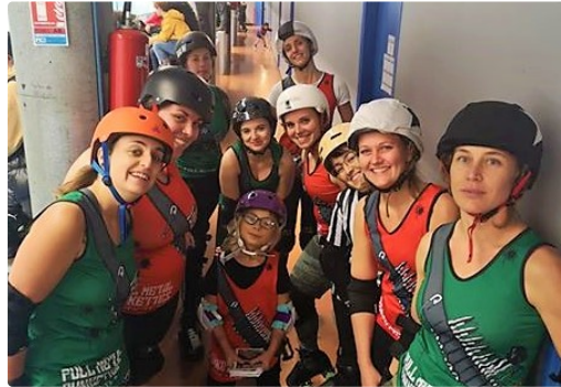
Full Metal Punkettes recherchent Very Bad Types

Elles sont quatorze, âgées de 19 à 38 ans, pleines d'énergie, de punch et de fun. Elles, ce sont les Full Metal Punkettes, les joueuses de l'équipe de roller derby de Tarbes.