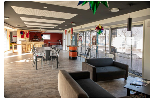
Le nouveau club-house