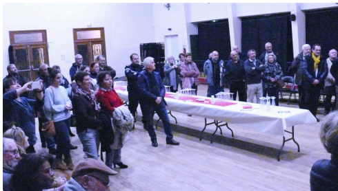
Une partie de l'assistance.