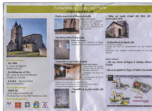
Résumé des travaux (qui toucheront aussi l'église dans son ensemble)