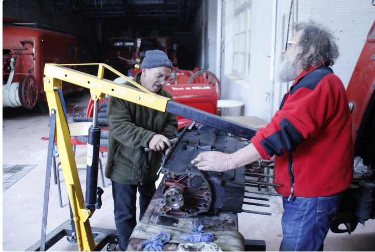
Au travail !

Encouragés par la récompense d'une belle dotation dans le cadre du budget participatif gersois 2019, les membres du musée des sapeurs-pompiers de Miélan travaillent avec ardeur pour la création d'une salle d'exposition de petit matériel et de projection dans le local mis à disposition par la municipalité.