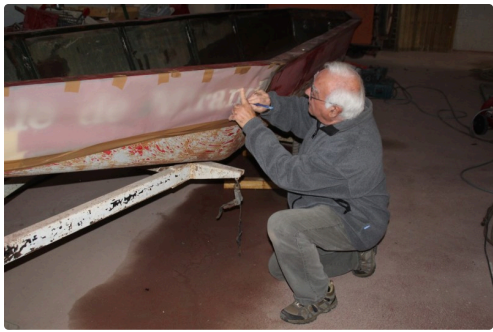
"Ville de Mirande", préparation d'un pochoir (1)