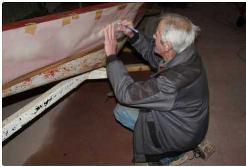
"Ville de Mirande", préparation d'un pochoir (2)