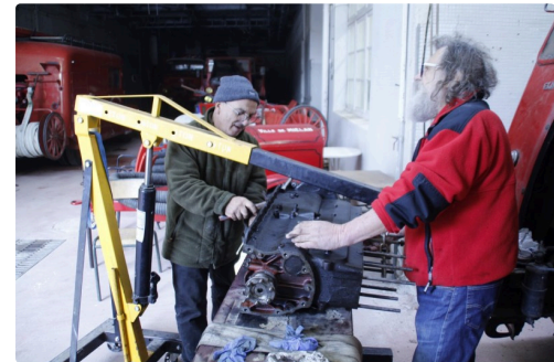
Dépose des pistons