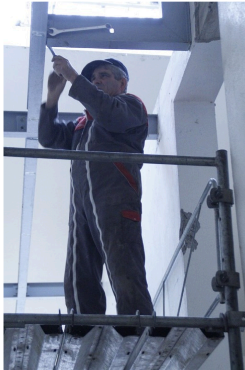
A l'autre extrémité de la poutre.