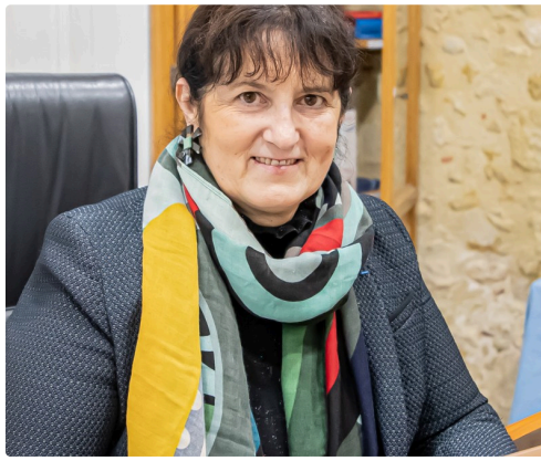
Le ruban bleu est sur la boutonnière à droite