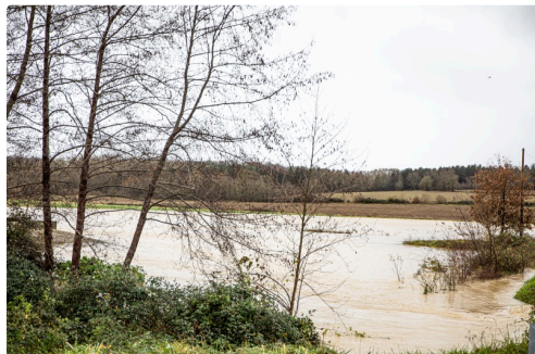
Abords du Midour à Bouzon

Mais, partout, la campagne est inondée, beaucoup plus que d'habitude en cette saison.