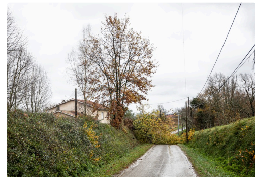
Route barrée par un chêne déraciné