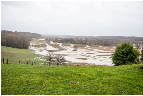
Le marécage en formation l'après-midi