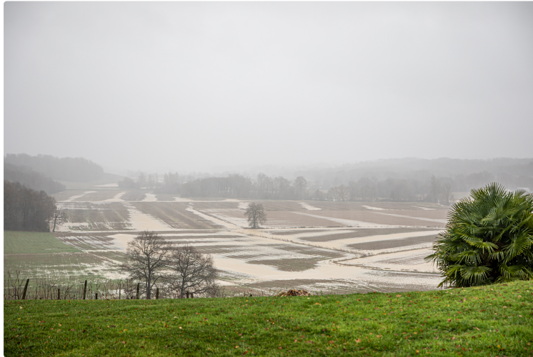
Tempête sur l'Armagnac