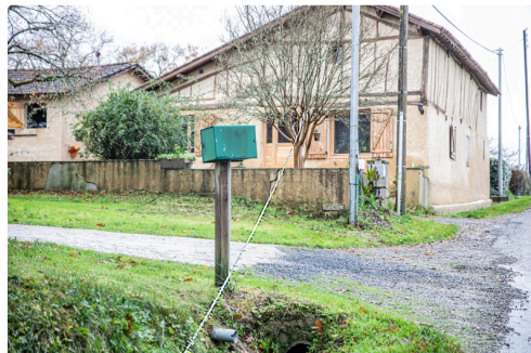
Câble téléphonique à terre entre 4 poteaux