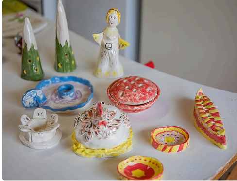
Cendriers pique-fleurs bougeoirs, photophores