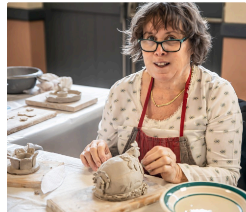
Une poule qui couve, est en train de naître