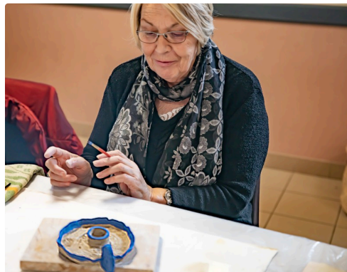
Le bougeoir est coloré en bleu