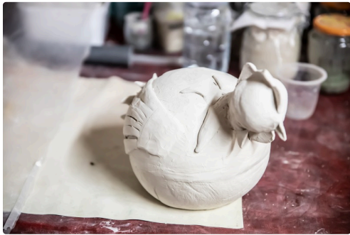
Une belle poule dont le façonnage n'est pas terminé