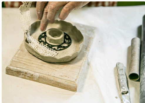
Façonnage d'un bougeoir

N.B. - La photo du haut de page a été communiquée par Émile Collado.