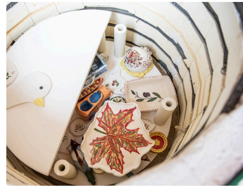
Un des étages du four