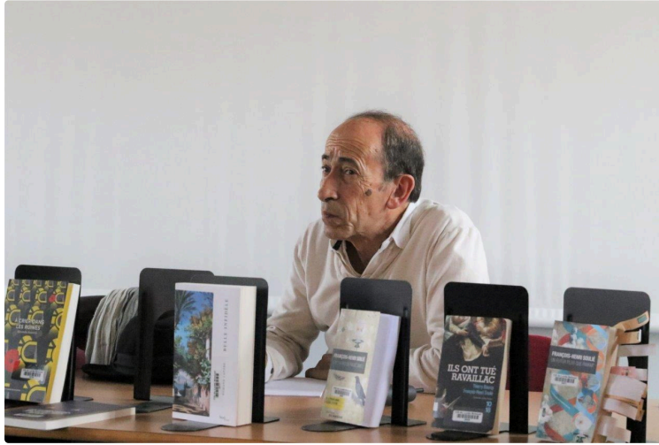
Le lycée Bossuet participe au Prix Jeune Mousquetaire du Premier Roman