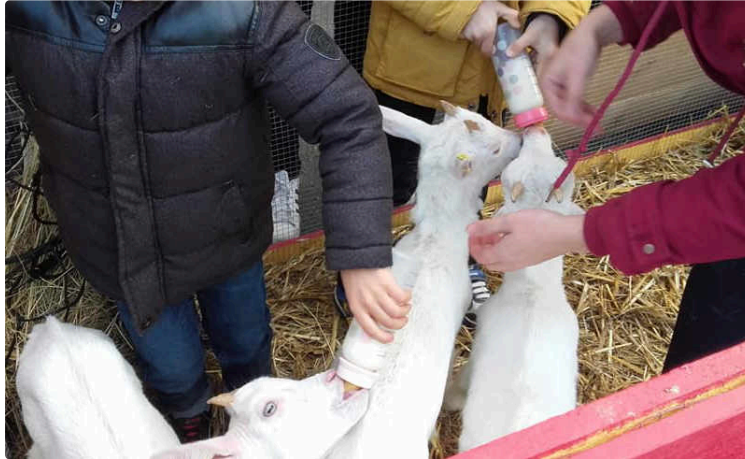
Samedi 7 décembre, journée d'adoption plutôt réussie

Mais fin de semaine, réveil, comme pour beaucoup peut-être, un peu difficile !