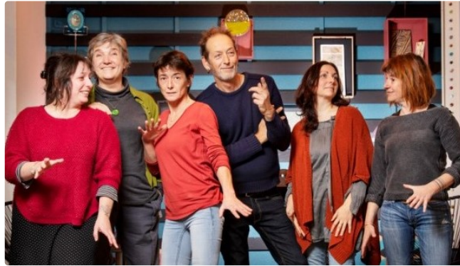
L'art et la matière

Sept artisans d'art ont ouvert « Matières », un vivant espace d'exposition