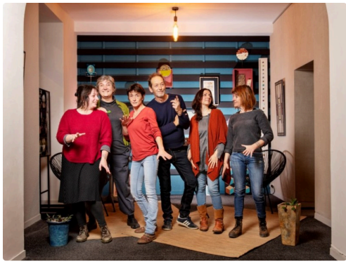
L'équipe de Matières, presque complète.