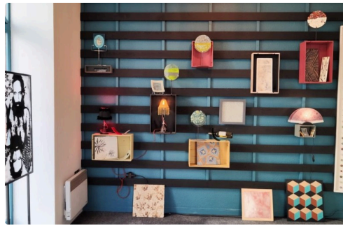
Exposition de talents