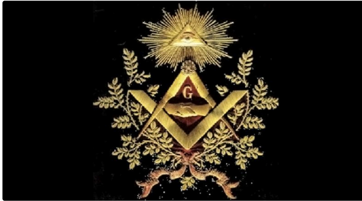
Brève initiation à la Franc-maçonnerie

Une conférence, ce jeudi, sur ce qui fait l'un des piliers de notre République.