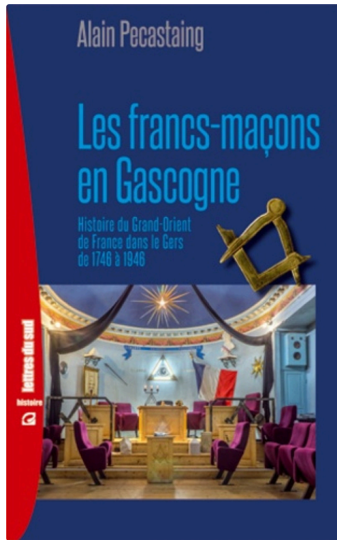
Une histoire régionale de la Franc Maçonnerie