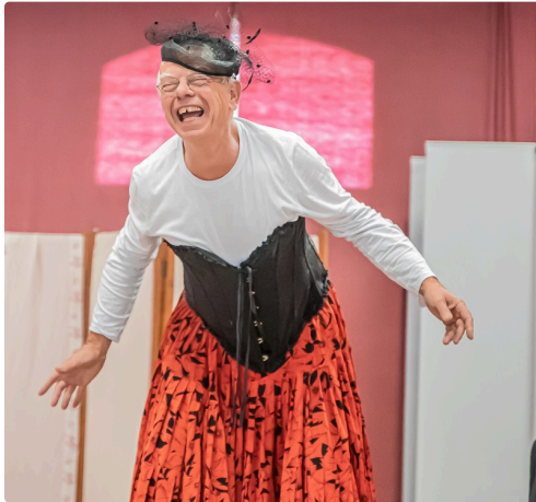
Déguisé en femme