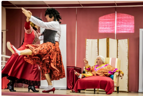
Le "mourant" exige que ses soi-disant soeurs dansent