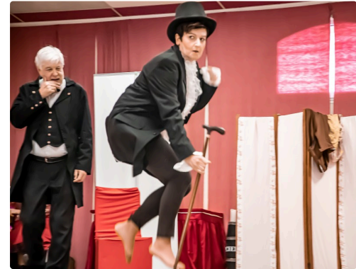
Habits et démarche masculine