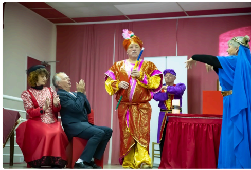
Entrée du Mamouchti