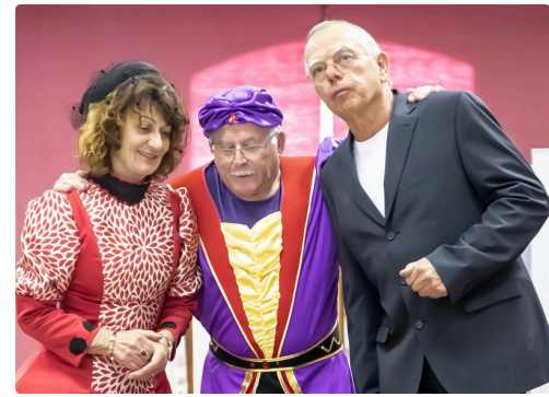
Venez le voir : il est mourant !