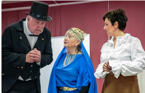
Venez le voir : il est mourant !