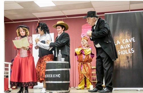
L'arnaque va-t-elle être dévoilée ?...