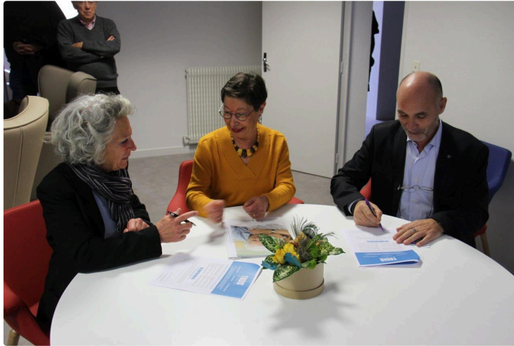
La ville propose un nouvel accueil chaleureux pour les malades d'Alzheimer

Depuis lundi 9 décembre, au 27 avenue d'Aquitaine, Condom offre aux malades d'Alzheimer un accueil de jour ouvert, la semaine, du lundi au vendredi, de 10 h à 17 h dans des locaux fonctionnels et accueillants.