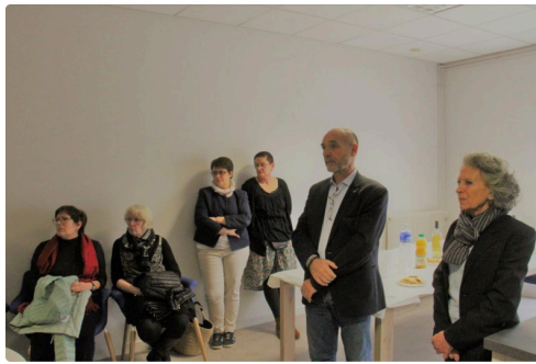
Bénévoles et responsables à l'écoute