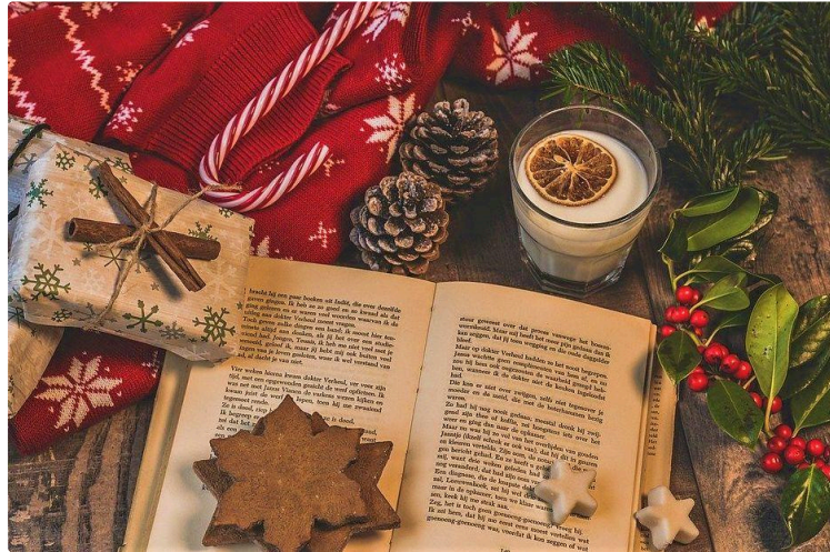
À vos marque-pages !

Chaque premier samedi du mois, le Journal du Gers vous propose une balade chez les libraires et vous révèle leurs coups de cœur du moment.