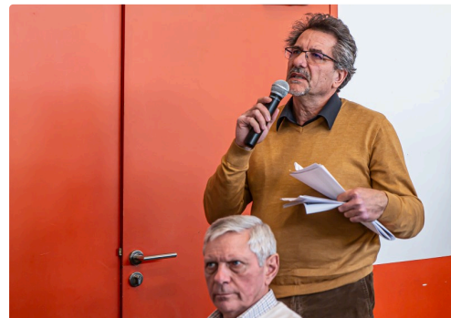
7 Le maire de Saramon 1bis 271119.jpg