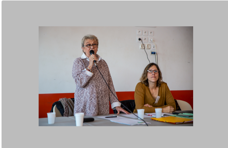
Une vision pour le Scot de Gascogne (mis à jour)