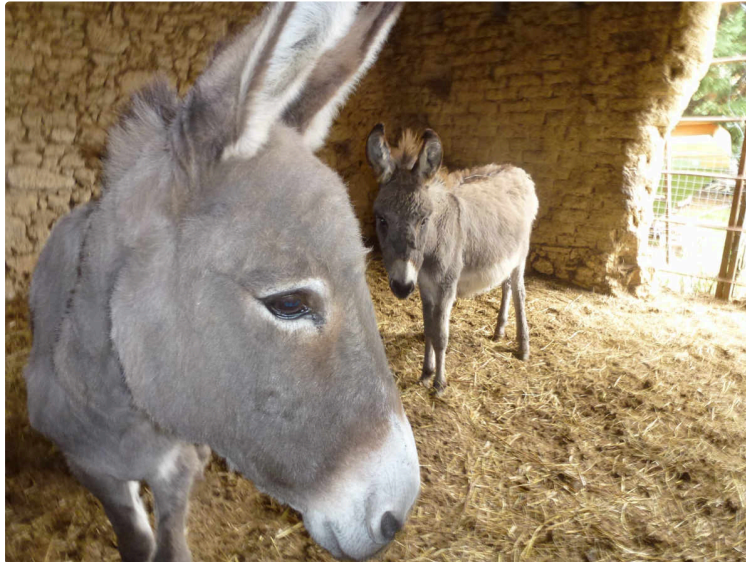
Les animaux de ferme ont leur refuge

A Peyrecave, une association s'emploie à les mettre à l'abri