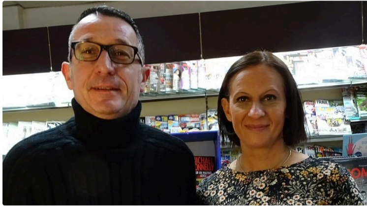
Offrez le livre « Le Féminisme pour les Nul·le·s », co-signé par un Gersois

Une idée de cadeau originale et pour tous