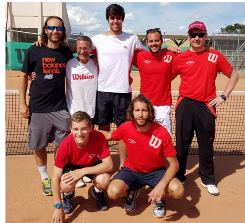
L'équipe 1 Messieurs