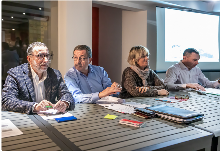
Un Tennis-club en excellente santé à Nogaro

Assemblée générale dans le club-house rénové