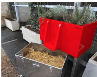
Dans la Ville Rose, on peut faire pipi dans les fleurs