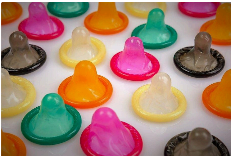
« Capote ta vie !!! » 52 établissements gersois y participent

Dimanche 1er décembre : Journée Mondiale de lutte contre le SIDA