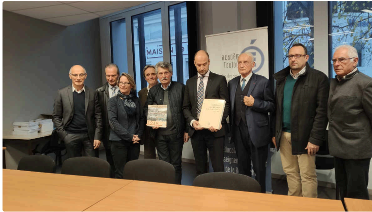
Le Mémorial des Gersois morts pour la France : une arme positive dans la bataille pour le devoir de mémoire

La Société archéologique et historique du Gers vient d'éditer le Mémorial des 8.464 Gersois Morts pour la France pendant la grande guerre.