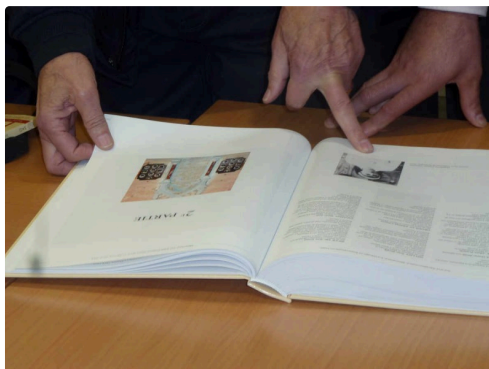
Un ouvrage plein d'anecdotes, ainsi une seule femme dont la photographie se trouve au bas de cette page, est recensée parmi tous ces morts.