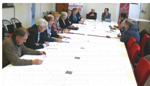
Les principaux acteurs associatifs de Gers Solidaire ont assisté à la réunion.