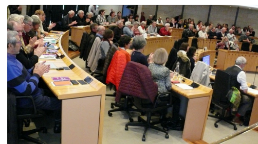
L'hémicycle était complet.