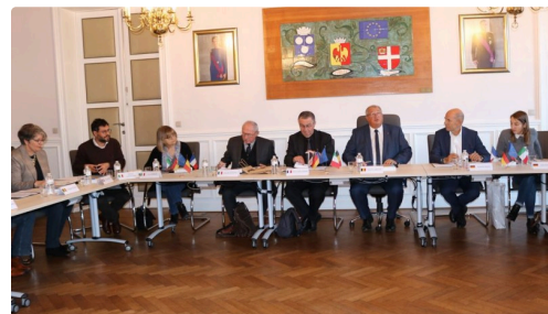
jumelage belgique 2.JPG

La réunion de travail avec les villes de San Mauro Torinese (Italie) et de l'Eliana (Espagne) se déroulera, quant à elle, à l'Eliana, le week-end du 29 & 30 novembre et permettra, de la même manière, d'établir un riche calendrier d'échanges.