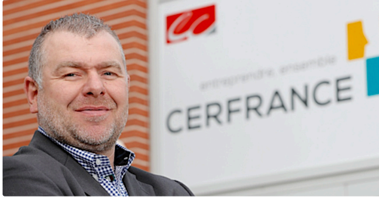
Deux Gersois à la tête de Cerfrance Gascogne-Occitanie