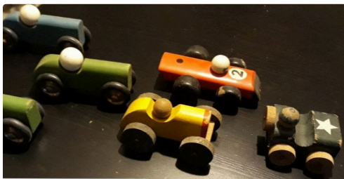
Petits bolides en bois des années 40 oubliés dans un tiroir, et récupérés par l'association aubiétaine qui remercie les donateurs.