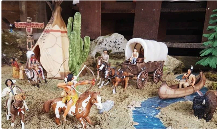
Adulte, venez retrouver votre âme d'enfant ...

... et enfant, délaissiez le virtuel pour le réel ... et découvrez des vrais jeux que vous pourrez toucher !