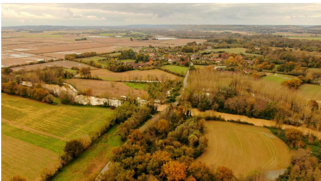
Izotges ©Laurent Lainé