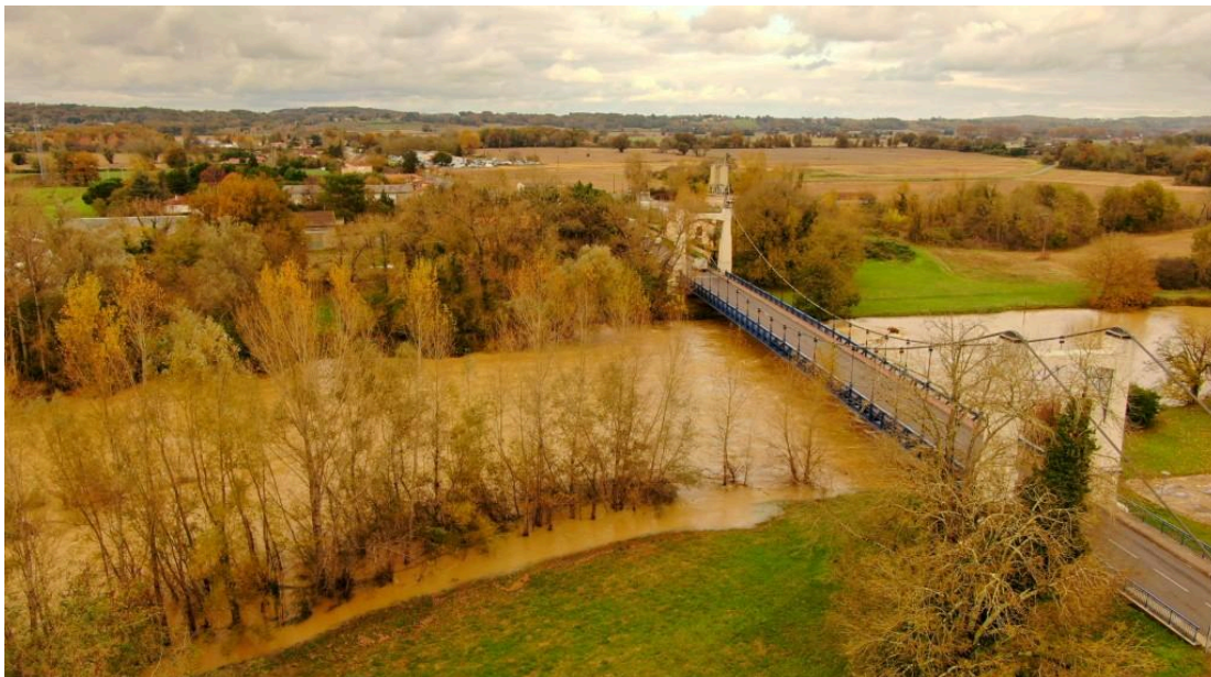
Riscle - Cet après-midi, vu du drone