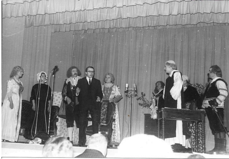
Le Comité Départemental de Théâtre amateur fête ses 30 ans

Exposition de photos du théâtre, à Mauvezin, de 1948 à 1991