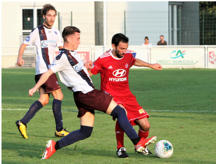
Football 7e tour de Coupe de France : Auch prêt pour l'exploit

Face à Rodez, Ligue 2, les Auscitains jouent ce samedi 16 novembre, à 14 heures, "leur match référence" selon le capitaine Damien Graves