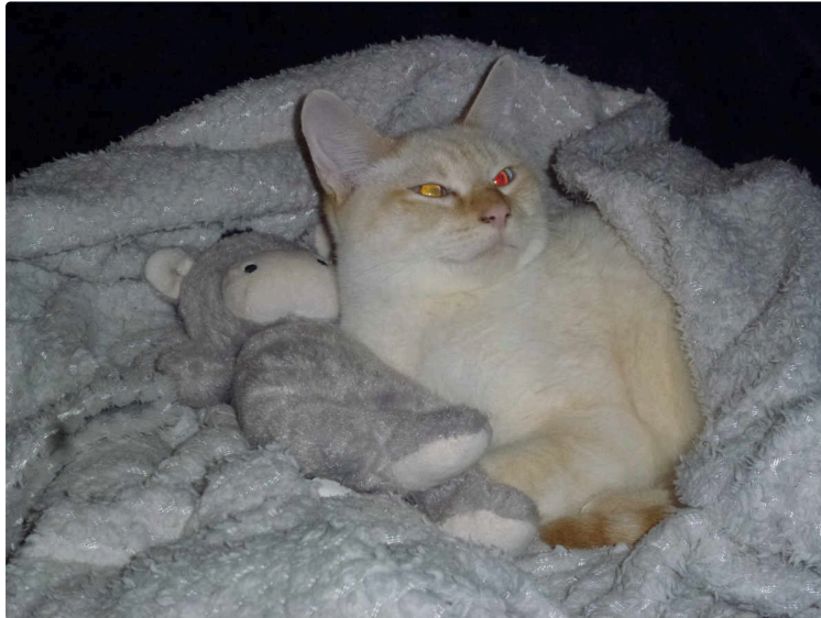
Velcro, une histoire si banale !

Des jeunes qui vagabondent par faute de stérilisation des chattes !