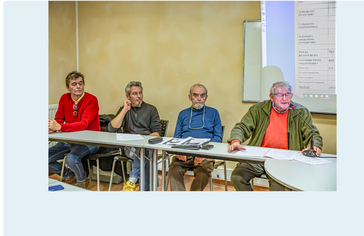
Pimao va harmoniser les cantines du Bas-Armagnac

Une assemblée générale très dense pour son 1er anniversaire