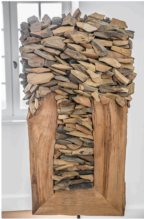
Terroir de Pierre Martin - Sculpture exposée au château de Crouseilles en 2017