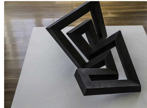
Sculpture de Pierre Martin exposée au château de Crouseilles en 2017