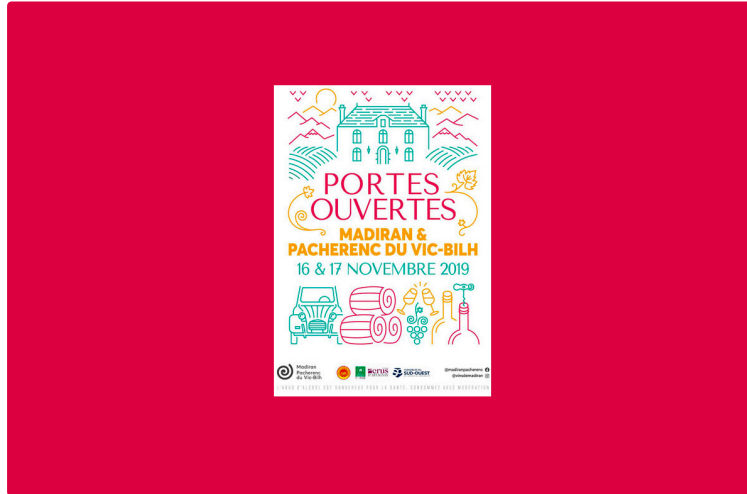
Aux Portes ouvertes Madiran-Pacherenc...

Dans le cadre des Journées Portes ouvertes de l'appellation Madiran-Pacherenc, qui ont lieu samedi 16 et dimanche 17 novembre, une exposition Art et Vin se tiendra au Château de Crouseilles, le dimanche 17 novembre, à partir de 10 heures. On sait que l'on y trouve aussi le meilleur des vins de Producteurs Plaimont, dont de beaux Madiran et de superbes Pacherenc du Vic-Bilh et d'autres encore.