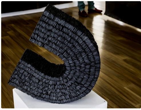
Sculpture de Pierre Martin exposée au château de Crouseilles en 2017