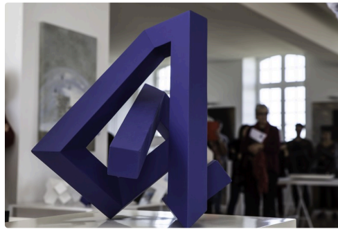
Sculpture de Pierre Martin exposée au château de Crouseilles en 2017