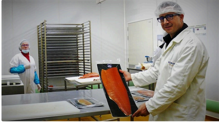
Fumaison Occitane : bonjour saumon, truite et esturgeon !

Née en 2017 des cendres de la société Moose Smokehouse, la Société Coopérative d'Intérêt Collectif Fumaison Occitane diversifie désormais sa gamme de produits, et surprend toujours plus les amateurs.