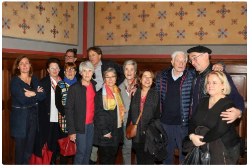
Photo souvenir de cette journée inaugurale pour la famille et les amis