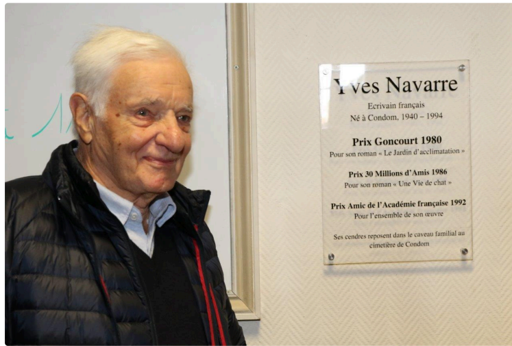
Yves Navarre en son pays

La médiathèque portant son nom a été inaugurée