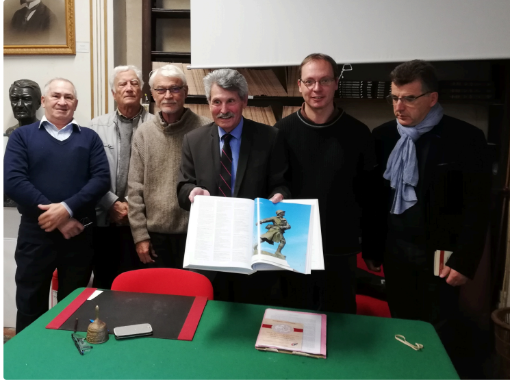
1919, le Gers au lendemain de la Grande Guerre