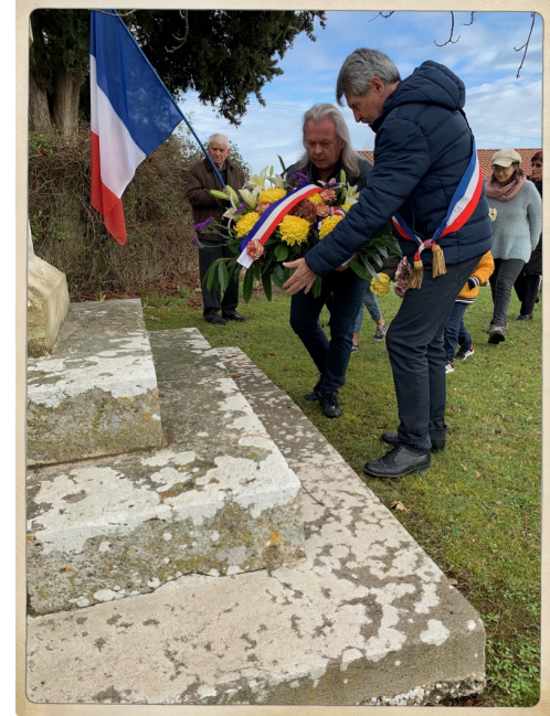
Dépôt de la gerbe