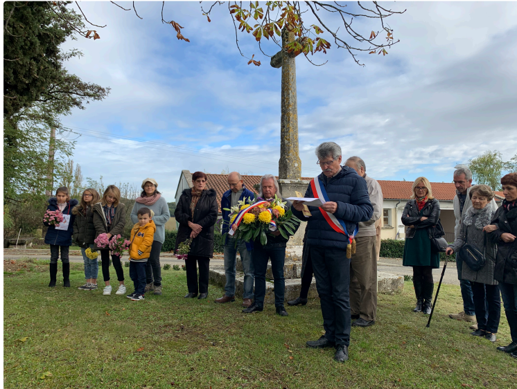
Morts pour la France !

Souvenir, souvenir, dans la petite commune de Larroque-Engalin.