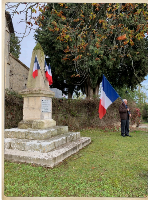
Le monument érigé en 1925 à la mémoire des 5 enfants de Larroque Engalin